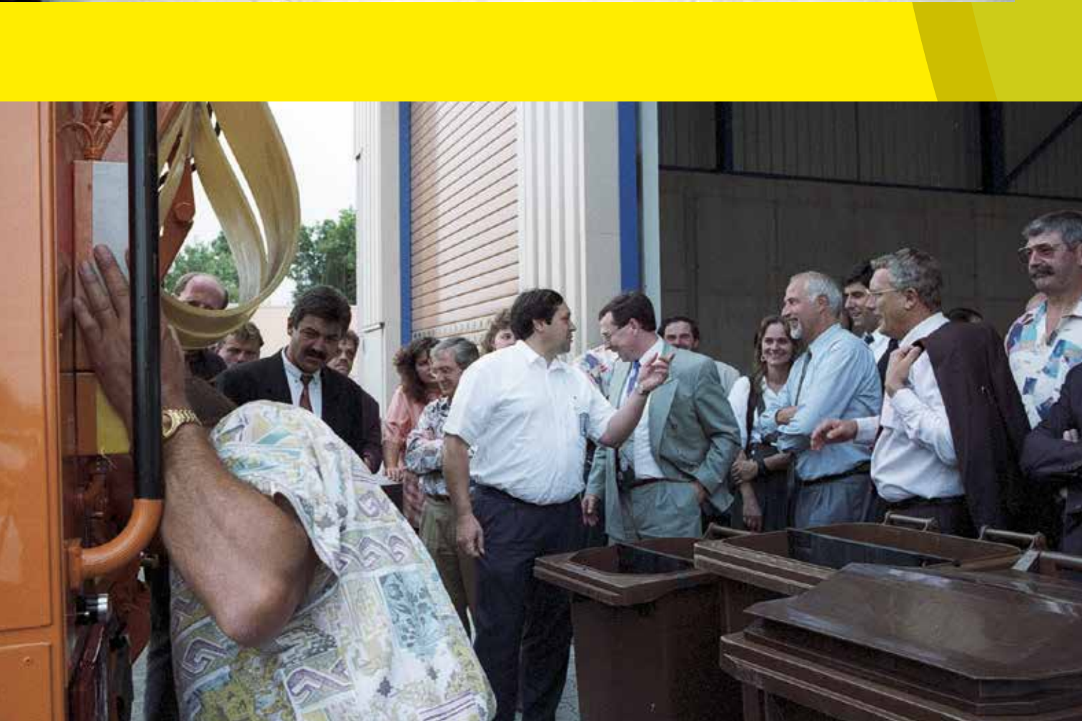
Bis 1998 Ruhe an der Abfallfront: