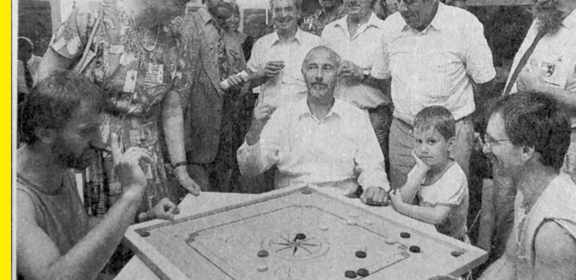
Der Rhein-Neckar-Kreis hat einen neuen Führer durch seine über 100 Schulen aufgelegt. Landrat Dr. Schütz stellte ihn im Kreis-Pavillon auf der Hockenheimer Landesgartenschau vor und nutzte die Gelegenheit, sich mit der dort präsentierten Spielausstellung des Kreisjugendamts auseinanderzusetzen...

Führer durch die über 100 Schulen des Rhein-Neckar-Kreises