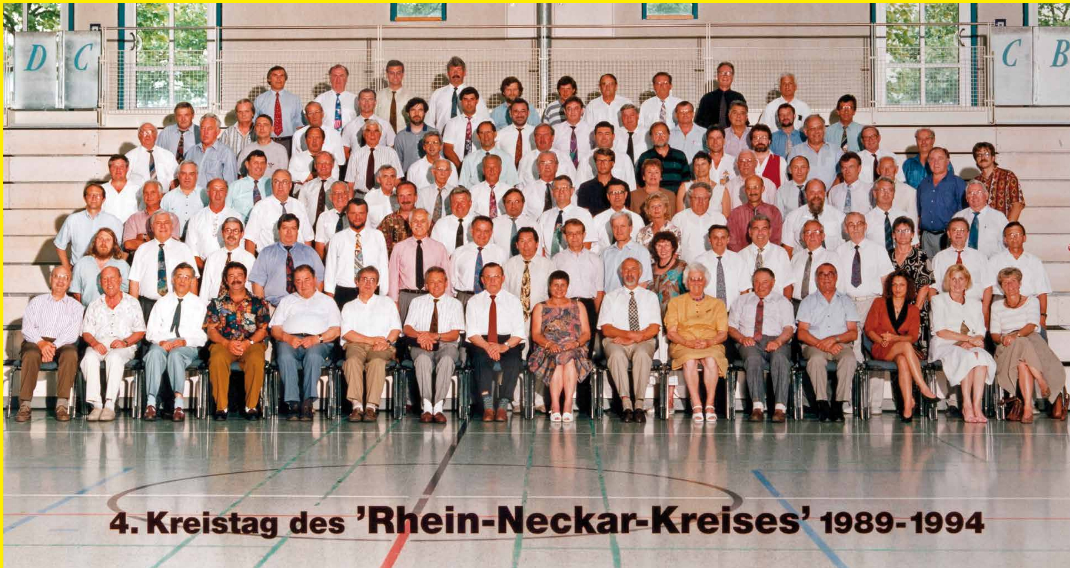
4. Kreistag des 'Rhein-Neckar-Kreises' 1989-1994