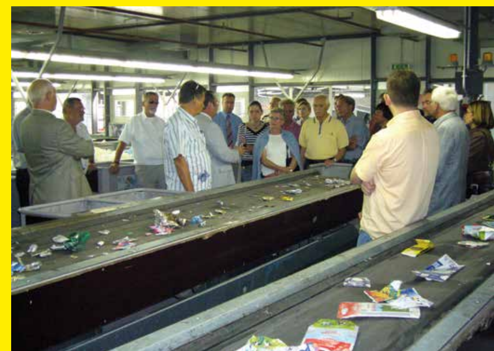
Müllverbrennung: Der Kreis kann aussteigen